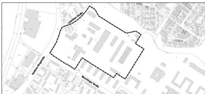
Lageplan zur Flächennutzungsplanänderung für den Bereich „Pioniergelände“