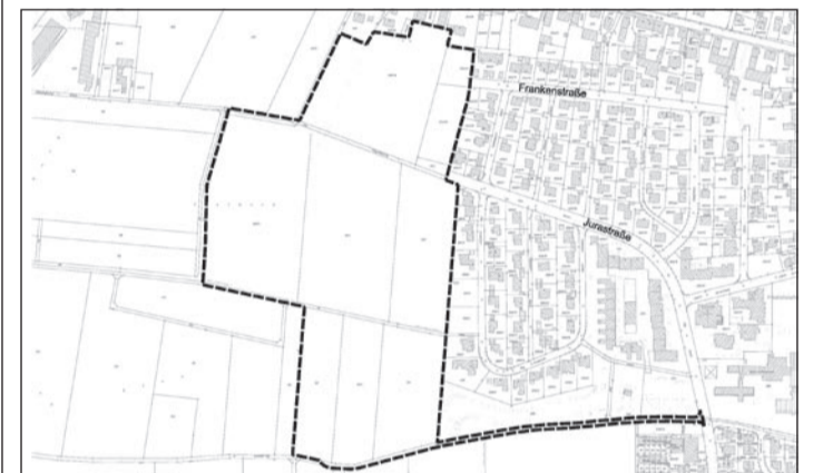
Lageplan zum Bebauungs- und Grünordnungsplan Nr. 195 „Friedrichshofen-West“

Äußerungen zur dargelegten Planung können während dieser Frist schriftlich oder zur Niederschrift abgegeben werden.