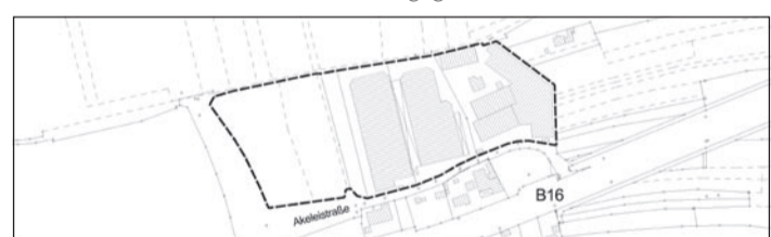
Lageplan zum Bebauungs- und Grünordnungsplan Nr. 715 A „Gewerbegebiet nördlich der Akeleistraße“

Äußerungen zur dargelegten Planung können während dieser Frist schriftlich oder zur Niederschrift abgegeben werden.