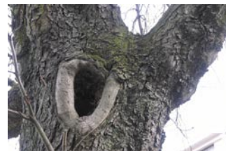
Unten: Faulhöhle an Astansatz

- Vorzeitige Fällung: Der Baum muss frühzeitig gefällt werden.