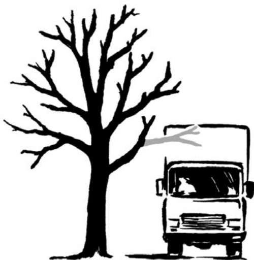
Korrekter Lichtraumprofilschnitt bei Ästen über 10 cm Durchmesser

Fast alle größeren (> 10 cm) Verletzungen an Bäumen bergen das Risiko, dass holzzeretzende Pilze eindringen und das Holz zersetzen. Dies geschieht meist erst nach 10 - 20 Jahren. Das Risiko von Fäulebildung ist geringer, wenn nur Splintholz verletzt wird, und größer, wenn - wie bei einem Starkastschnitt - Kernholz geschädigt wird.