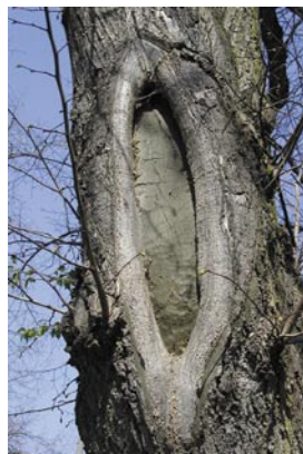
Links: Starkastschnitte führen langfristig zu Fäule. Diese Schnittführung entspricht nicht mehr dem aktuellen Stand der Technik.