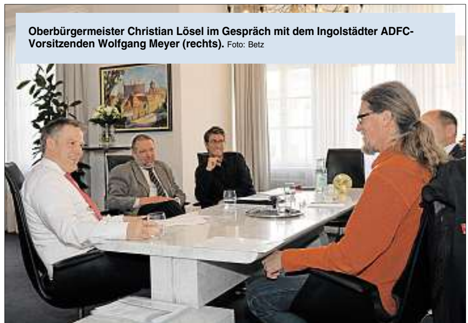
Oberbürgermeister Christian Lösel im Gespräch mit dem Ingolstädter ADFC-Vorsitzenden Wolfgang Meyer (rechts).

Gleich zu Beginn des konstruktiven Gesprächs verwies Oberbürgermeister Lösel auf den städtischen „Fahrrad-10-Punkte-Plan“, der gezielt Schwachstellen aus dem Fahrradklimatest aufgreift. So soll zum Beispiel die Fahrradmitnahme im öffentlichen Nahverkehr verbessert werden. Lösel will aber auch prüfen lassen, ob in Ingolstadt öffentliche Leihfahrräder-Konzepte umgesetzt werden können. Lobende Worte vom ADFC-Vorsitzenden gab es vor allem für die geplanten „Vorrang-Routen“: Im Winter sollen durch Räum- und Streudienste durchgängige Wegeverbindungen geschaffen werden. „Aus unserer Sicht ist das ein wichtiger Punkt, denn dadurch kann gerade im Winter der Radfahrer-Anteil erhöht werden“, so Meyer. Die „grundsätzlich gute Rad-Infrastruktur“ in Ingolstadt werde getrübt durch einige Lücken und Schwachstellen im Radwegenetz, die noch geschlossen werden müssten. Auch die Ampelsteuerungen und das Baustellenmanagement seien oftmals nicht optimal auf Radfahrer abgestimmt. Baureferent Alexander Ring nahm beide Anregungen auf und prüft Verbesserungen. Ein grundsätzli-