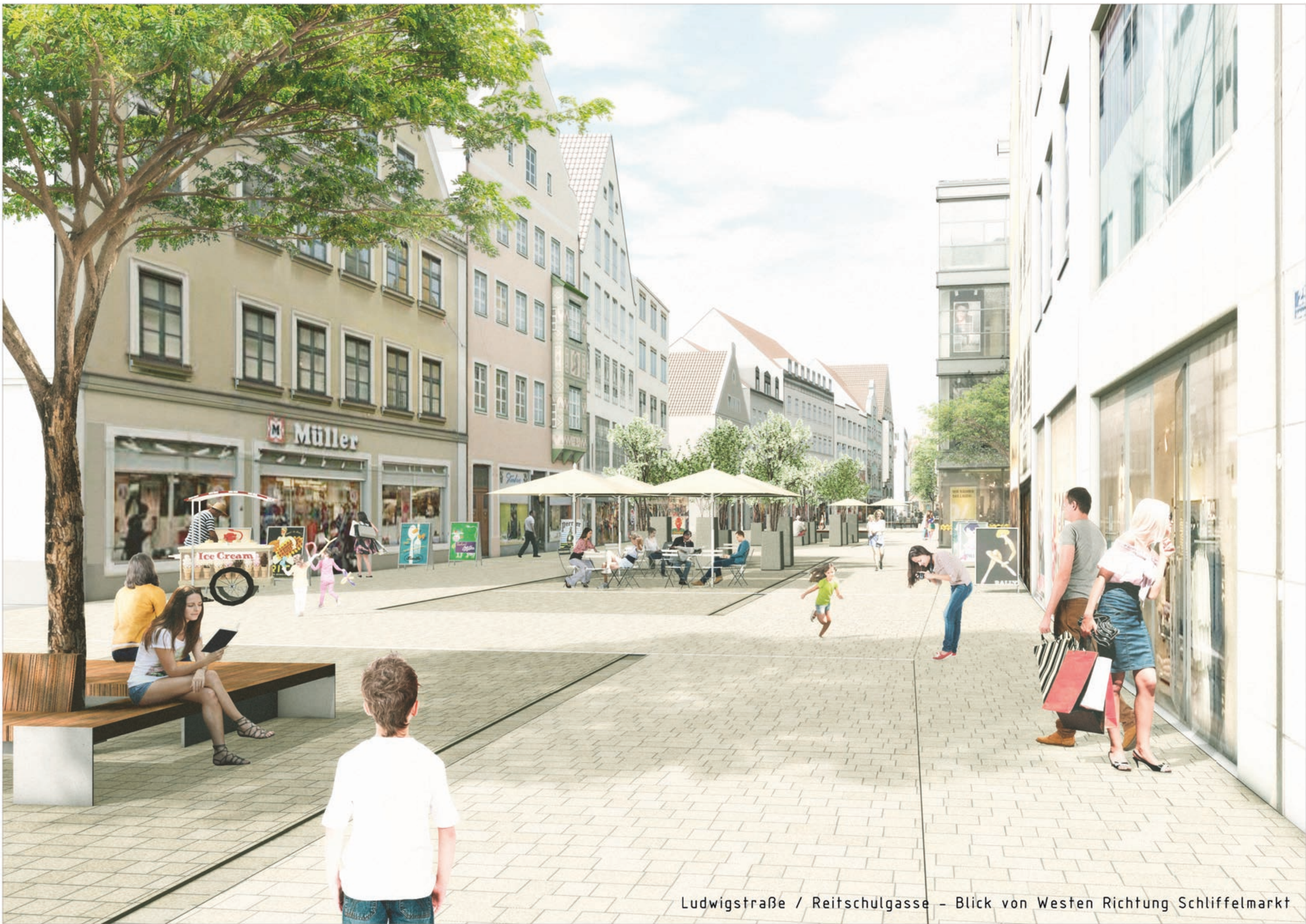
Ludwigstraße / Reitschulgasse - Blick von Westen Richtung Schiffelmarkt