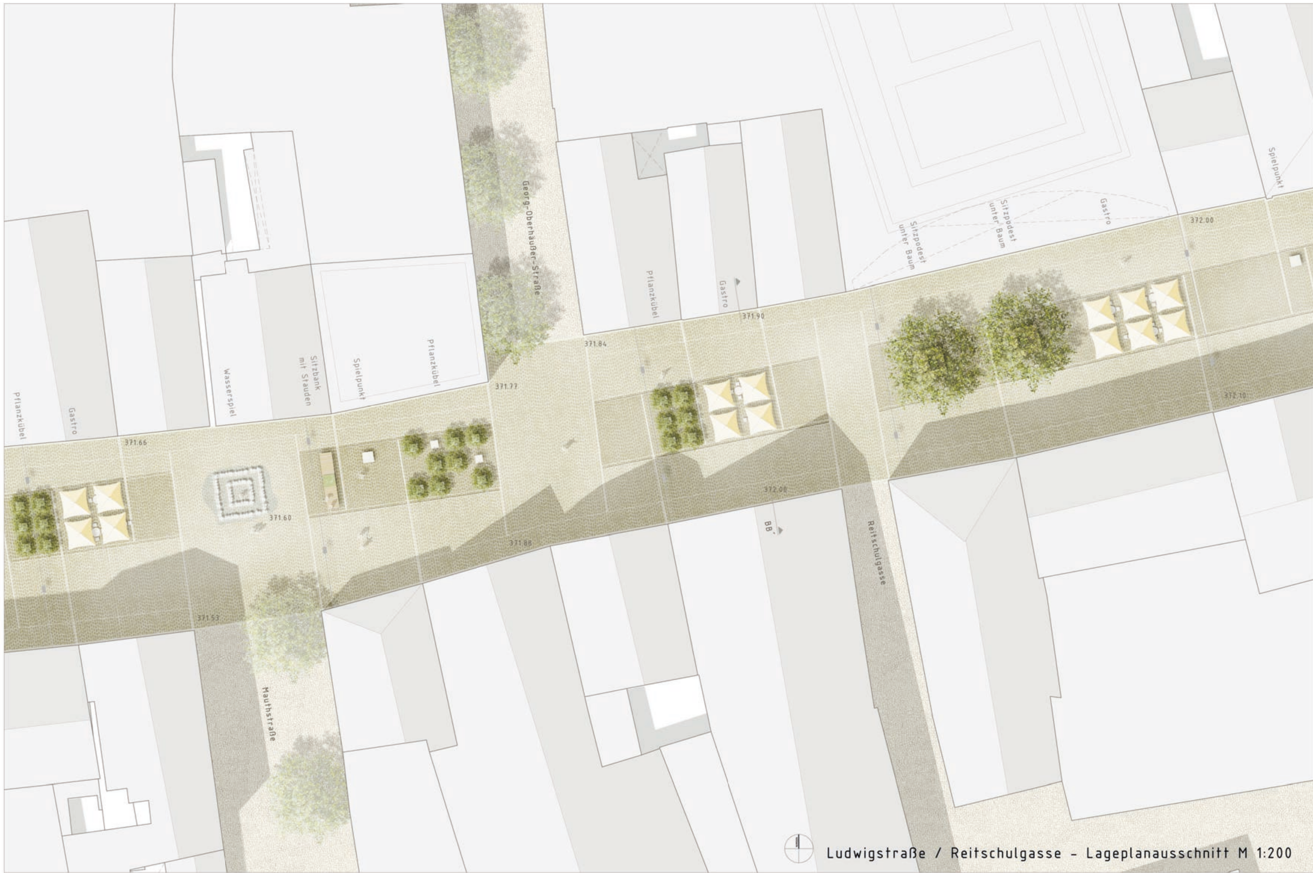
Ludwigstraße / Reitschulgasse - Lageplanausschnitt M 1:200