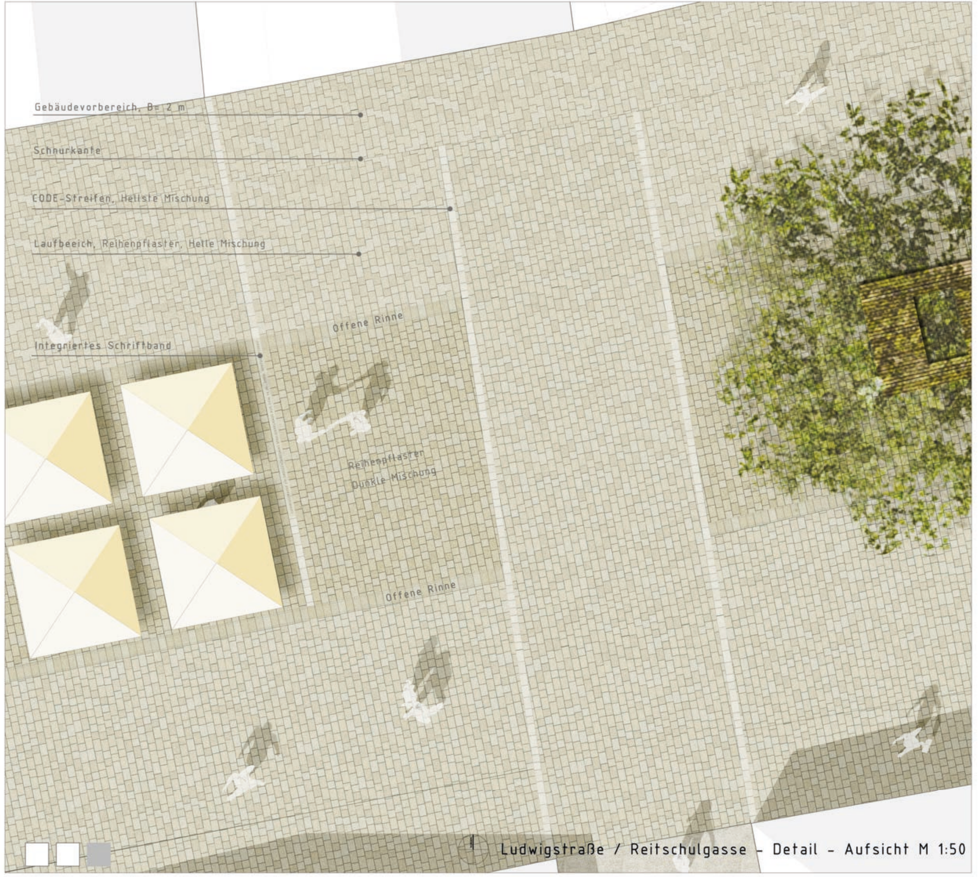
Ludwigstraße / Reitschulgasse - Detail - Aufsicht M 1:50