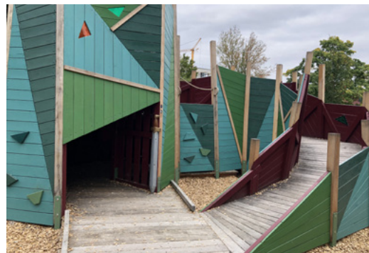
z. B. Drachenspielfeld Regensburg

Jede/-r muss am Spielplatz ankommen , jede/-r muss bis zum Spielgerät hinkommen und jede/-r muss mitmachen können.