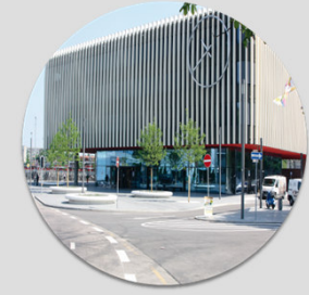
Bau von Infrastruktur/ Gebäuden