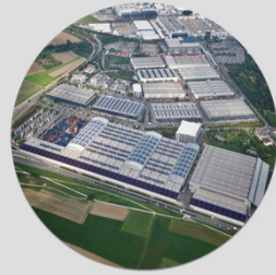
Bau und Betrieb des Güterverkehrszentrum