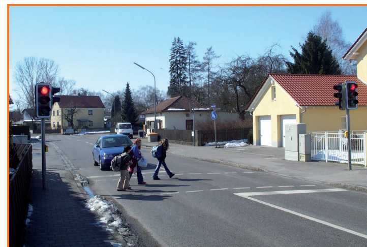
Fußgängerampel in der Beilngrieser Straße