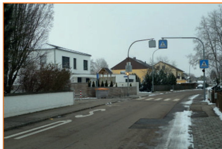
Fußgängerüberweg am Weckenweg