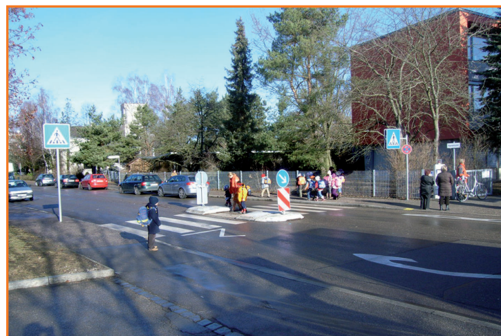
Fußgängerüberweg in der Jurastraße