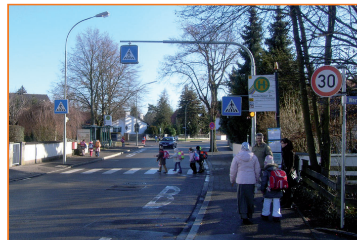
Fußgängerüberweg in der Schultheißstraße